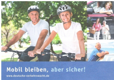
Mobil bleiben, aber sicher! www.deutsche-verkehrswacht.de

Überschlagsimulator und Infostand mit Seh- und Reaktionstestgerät, Informationen rund um die Sicherheit.