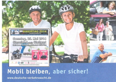
Mobil bleiben, aber sicher! www.deutsche-verkehrswacht.de

Infostand mit Seh- und Reaktionstestgerät, Motorradsimulator, Gurtschliffen Informationen rund um die Sicherheit.