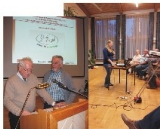
Vortragsreihe in Eislingen