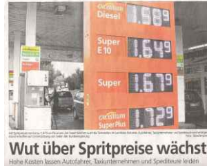
Wut über Spritpreise wächst Hohe Kosten lassen Autofahrer, Taxiunternehmen und Spediteure leiden