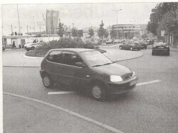
Dieser Autofahrer hält sich an die Vorschriften und blinkt bei der Ausfahrt aus dem Kreisverkehr. Laut Überprüfungen der Kreisverkehrswacht und des Auto-Clubs Europa (ACE) setzt jeder dritte Fahrer keinen Blinker.